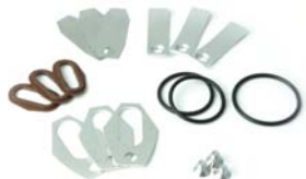
T-REVフルオーバーホールキット

※フルオーバーホールキットにはオーバーホールするために必要な部品が全て含まれています。 DUCATI のオーバーホールに関しては別途【ドゥカティ専用工具】が必要な場合があります。