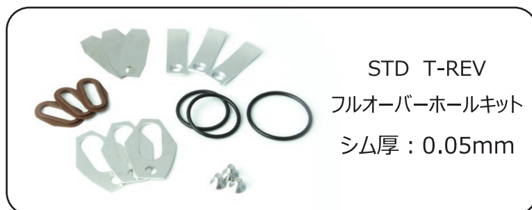
STD T-REV フルオーバーホールキット シム厚：0.05mm