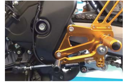
写真は BabyFace 製バックステップ