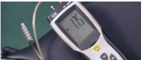
STD アイドリング -1.75khp