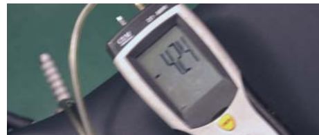
レース用ドライカーボンスロットル 空吹かし -4.24khp