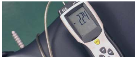
T-REV アイドリング -2.24khp